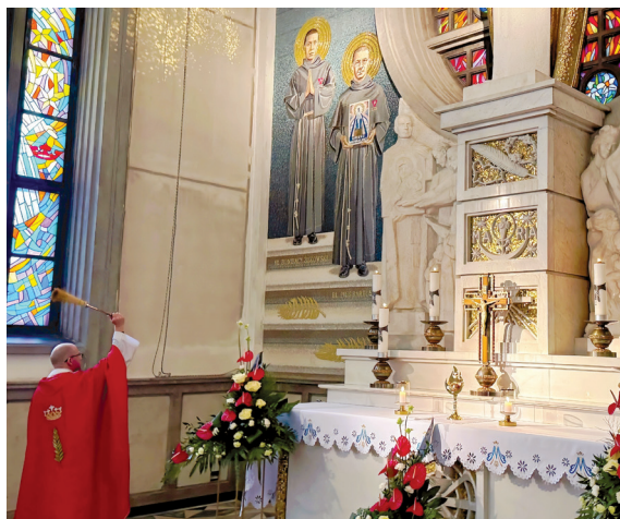
NA ZDJĘCIU: POŚWIĘCENIE MOZAIKI PRZEZ PROWINCJAŁA O. PIOTRA ŻURKIEWICZA OFMCONV