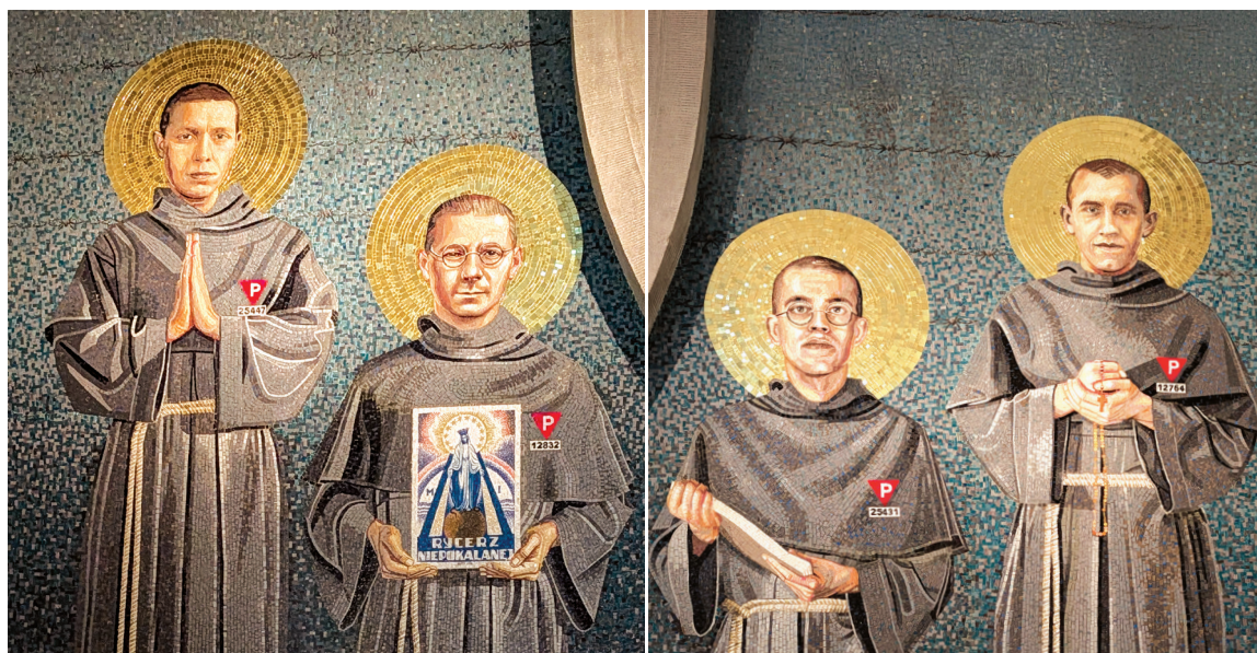
NA ZDJĘCIU: MOZAIKA BŁ. MĘCZENNIKÓW Z NIEPOKALANOWA

17 lutego 2026 r. obchodziliśmy w Niepokalanowie 85. rocznicę aresztowania przez Niemców Ojca Maksymiliana Kolbego wraz z Jego czterema współpracownikami.