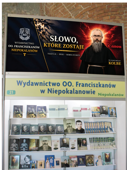
NA ZDJĘCIU: STOISKO WYDAWNICTWA OJCÓW FRANCISZKANÓW Z NIEPOKALANOWA NA TARGACH W WARSZAWIE

Dla wyjaśnienia: klasztor Niepokalanów oraz drugi podmiot, Nie-